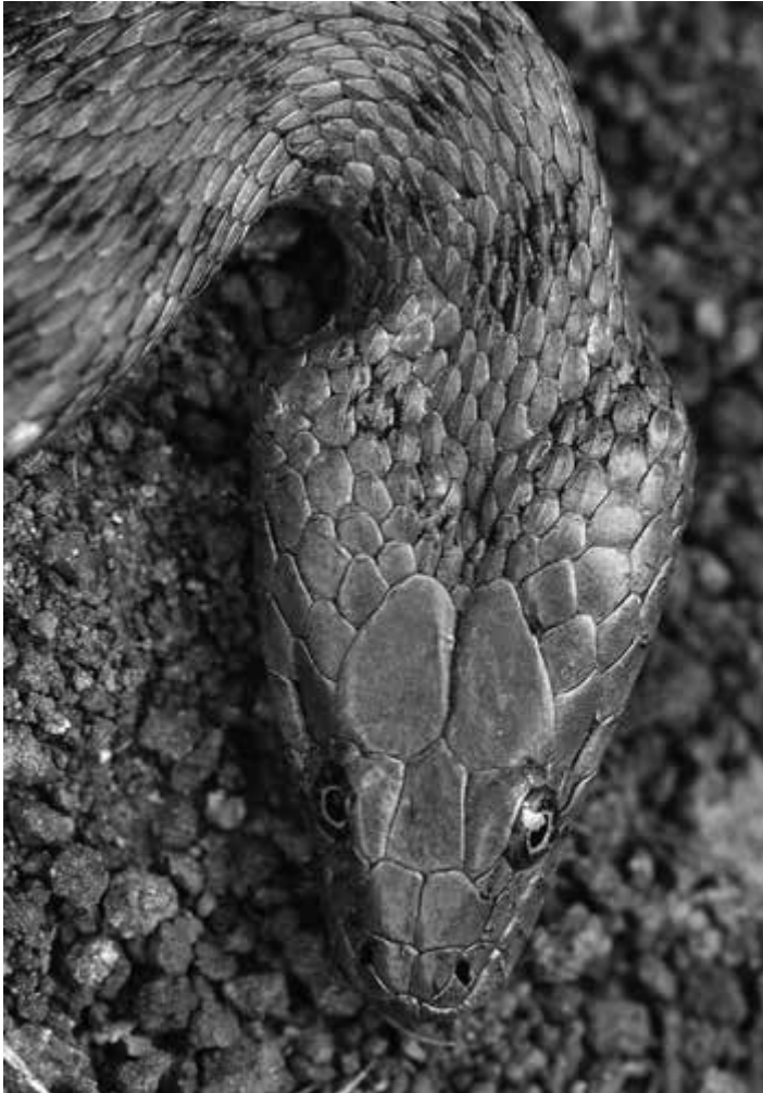
Dobbelsteenslang (Natrix tessellata), Italië, Soave, 2008/Dice snake (Natrix tessellata), Italy, Soave, 2008.

The next issue is a special about water snakes. In this voluminous edition will be articles published by Jeff Benfer, Steven Bol, Niels van Dalen, Erwin Goethem, Mark Krikke, Paul Storm, Fons Sleijpen, Bert Verveen.